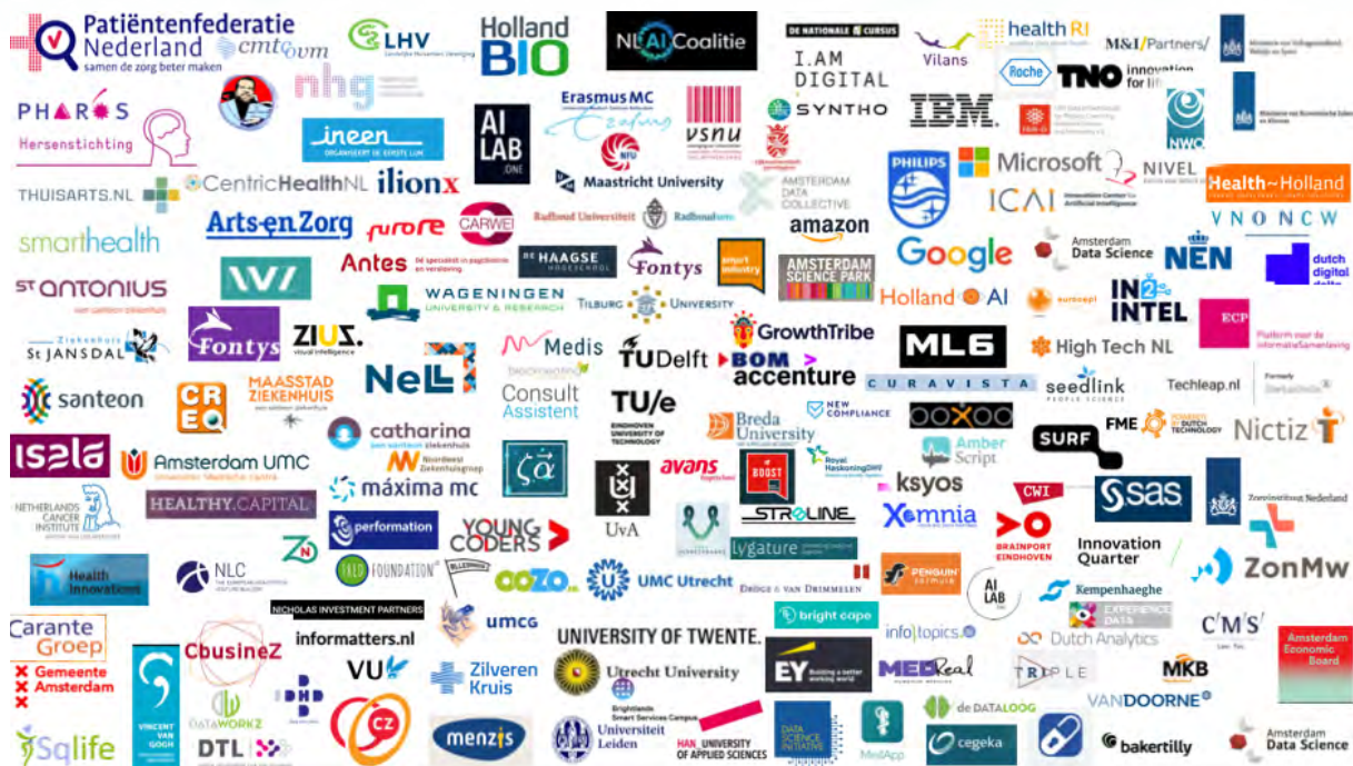
Organisaties aanwezig bij de start van de werkgroep Gezondheid en Zorg

Een combinatie van doelgerichtheid en brede samenstelling is noodzakelijk, want het is juist gezamenlijk dat we iets kunnen bereiken: burgers (al dan niet met een aandoening), preventieprofessionals, zorgverleners en zorgorganisaties, zorgverzekeraars, financiers en fondsen, innovatieve bedrijven, kennisinstellingen en overheden. Alleen door samen op te trekken, AI-toepassingen te ontwikkelen, te valideren en grootschalig beschikbaar te maken krijgen we zicht op onze kracht en op de huidige knelpunten en beperkingen.